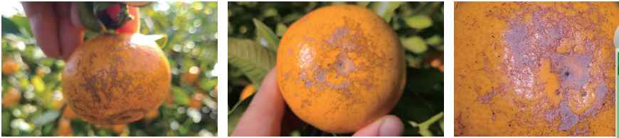
볼록총채벌레 피해 과실

「제라진」유제는 볼록총채벌레에 가장 뛰어난 효과를 나타냅니다. 장마 전·후 발생밀도가 높기 때문에 「제라진」유제를 사용하는 것이 매우 효과적입니다.